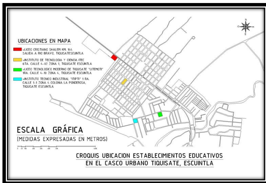
Figura No.1 Croquis de la ubicación de los establecimientos