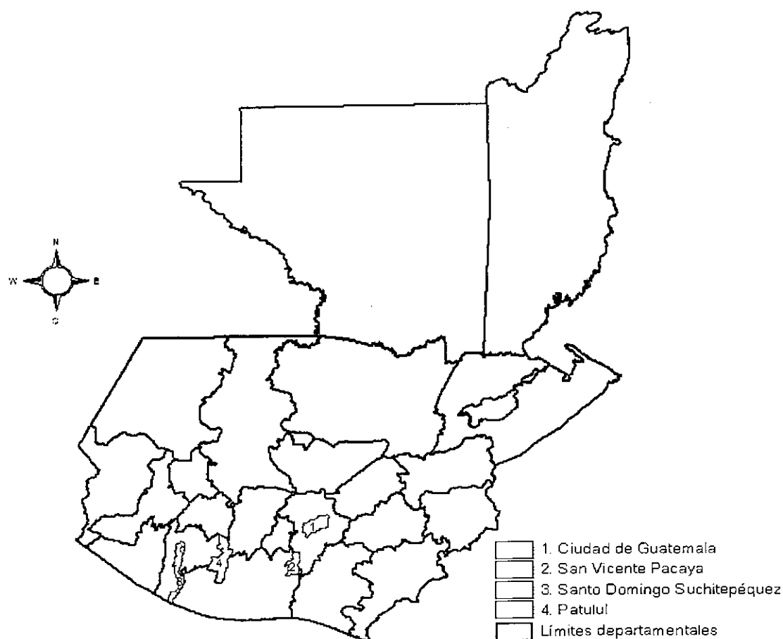
Ilustración 1. Mapa de ubicación de los municipios donde trabaja MadreTierra