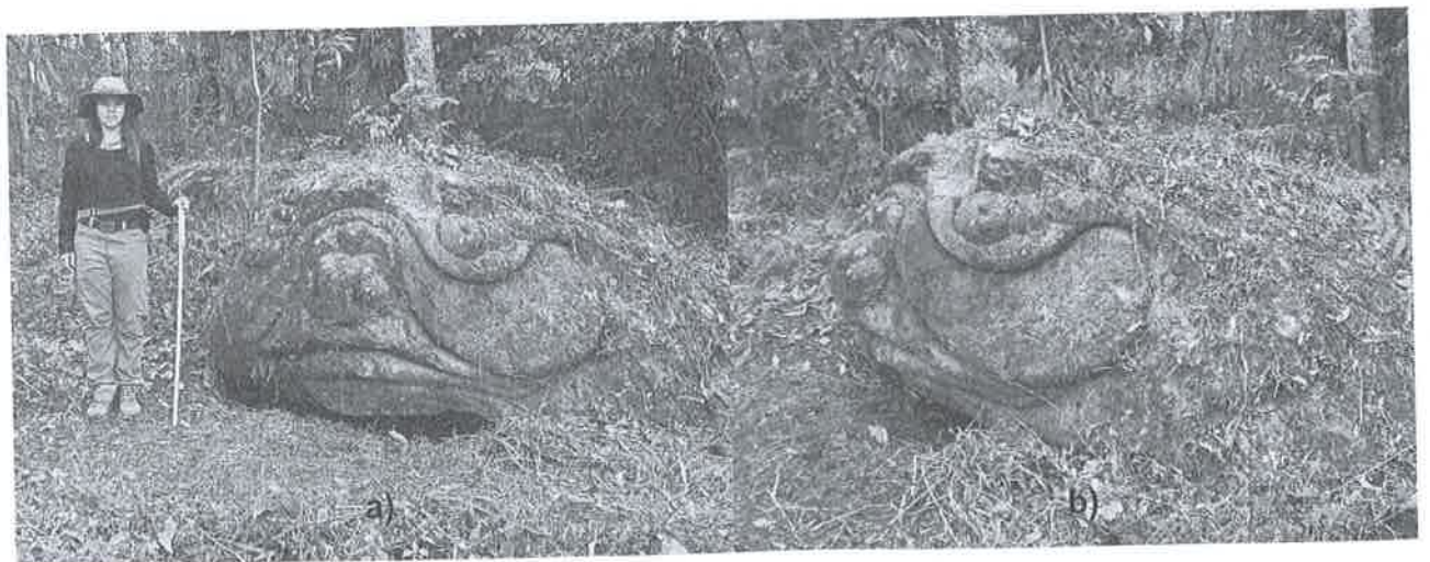
Figura 2. Escultura #1, a) vista frontal hacia el sur y b) vista de perfil hacia el este.