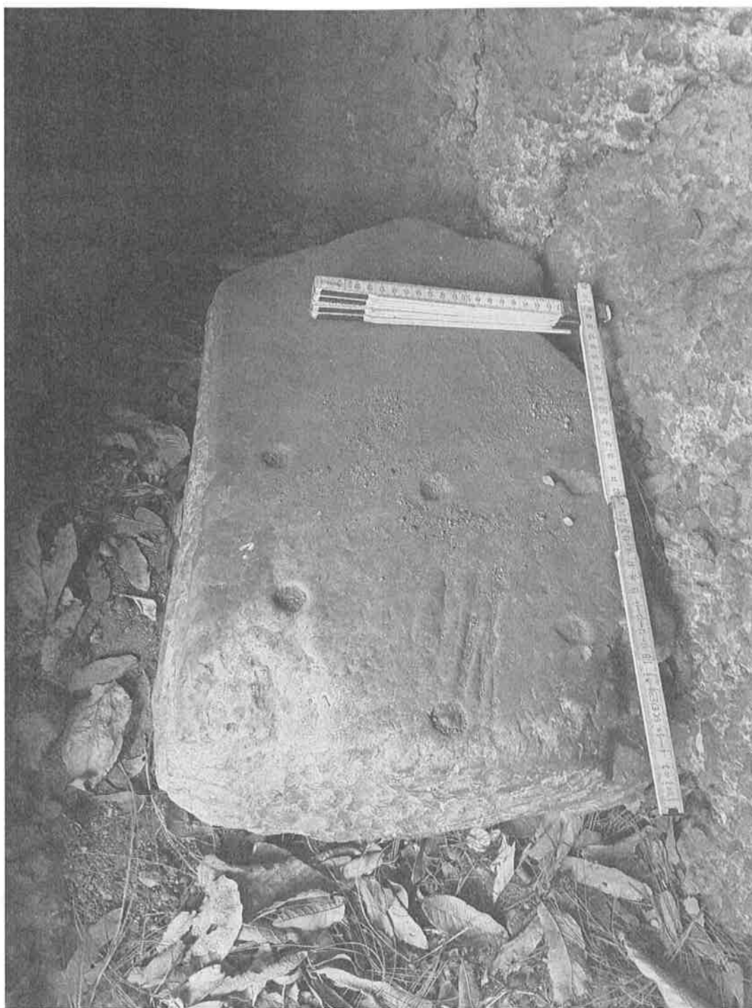
Figura 7. piedra con perforaciones talladas (Fotografía por E. Arredondo).