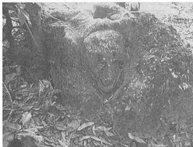
Figura 4. Petrograbado #1.