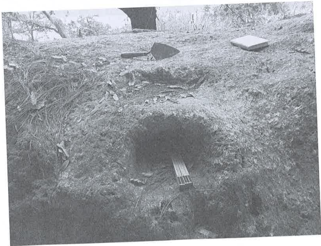
Figura 6. Petrograbado #4.