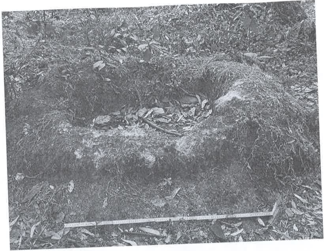
Figura 5. Petrograbado #2.