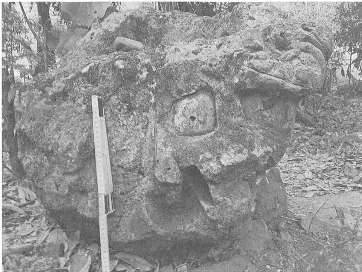
Figura 3. Escultura #2.