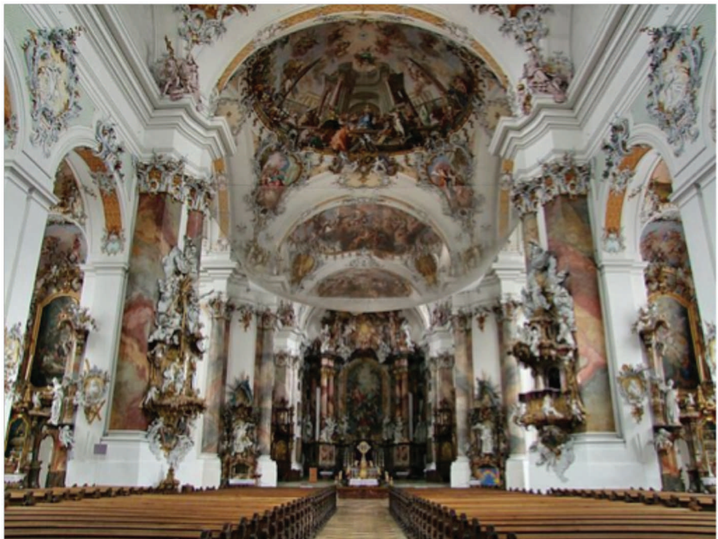
Nave principal de la Basílica de Ottobeuren, decoración de arcadas y columnas, crucero y altar al fondo.

https://en.wikipedia.org/wiki/Ottobeuren_Abbey