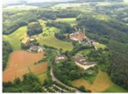
Vistas de la colina en donde se localiza la Basílica de Vierzehnheiligen. http://www.vierzehnheiligen.de/en/