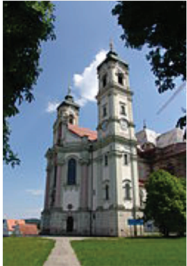
Vista exterior de la Basílica de Ottobeuren localizada en un entorno urbano https://en.wikipedia.org/wiki/Ottobeuren_Abbey

El interior es un enorme espacio luminoso mostrando en su decoración armonía de color, predominando los colores rosa, violeta, ámbar y ocre en un fondo blanco. El fresco que adorna la cúpula ilustra el Milagro de Pentecostés y el Altar representa a la Santa Trinidad. Sin embargo, antes de llegar al transepto, de un lado surge un púlpito decorado y enfrente una escultura compuesta que representa el Bautismo de Cristo, ambas obras de arte elaboradas por Juan José Cristian. El transepto en sí, que podría pasar por una nave alterna, alberga una serie de capillas con altares ricamente decorados. La magnitud dimensional y la exuberancia del entorno saturan los sentidos de tal forma que inhiben el discernimiento y estimulan una contemplación abrumadora.