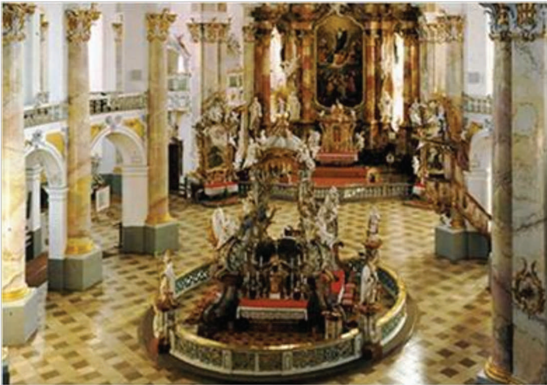
Nave principal de la Basílica de Vierzehnheiligen, el baldaquín en el centro y el altar en el fondo. http://www.vierzehnheiligen.de/en/