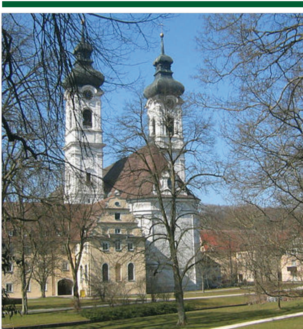
Vista exterior de la Iglesia de Nuestra Señora en Zweifalten localizada en un entorno urbano. https://en.wikipedia.org/wiki/Zwiefalten

Colores resaltados por la iluminación que penetra por las galerías con barandillas. Exuberancia en la decoración. Virtuosidad en el estucado. Pausadamente resaltan los detalles: los frescos en los techos abovedados dedicados a la Virgen, ángeles y querubines en las alturas laterales y esquinas dirigiéndose a los fieles en todas las direcciones, capillas adornadas, en la distancia el altar principal barroco con un soberbio enrejado.