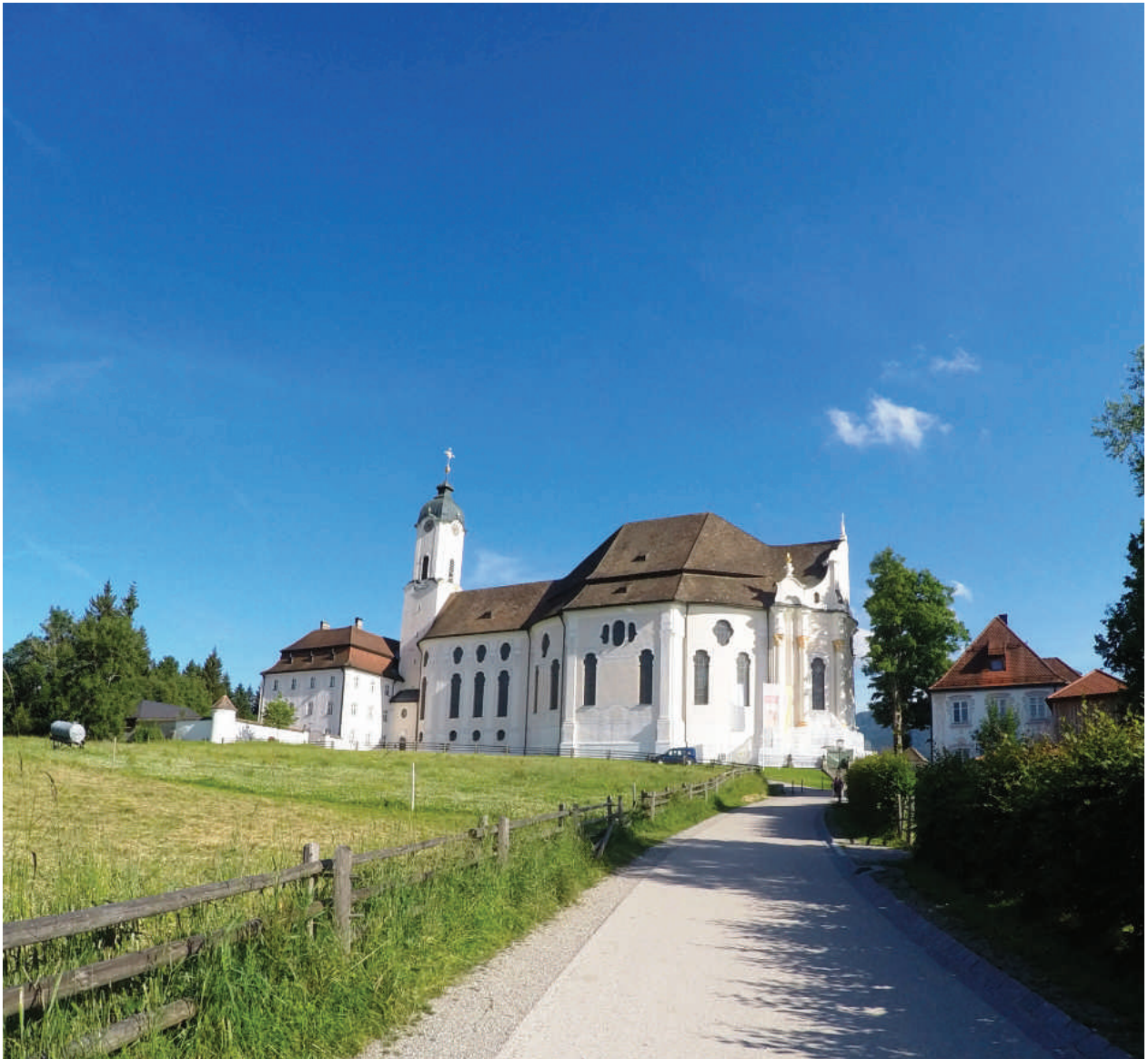
Iglesia de Wies localizada en un entorno rural.

La Iglesia de Wies (o iglesia en la pradera) se encuentra al pie de los Alpes Ammergau en la municipalidad de Steingaden en la parte sur de Bavaria entre los ríos Lech y Ammer cercada por bosques, prados y turberas. Es considerada como una obra maestra del rococó bávaro y fue considerada patrimonio de la humanidad por la UNESCO en 1983. Fue construida entre 1746 y 1754 por Domingo Zimmermann, miembro relevante de la escuela de artistas de Wessobrunn. Contó con la ayuda de su hermano Juan Bautista Zimmermann, pintor de la corte del Elector de Bavaria Max Emmanuel.