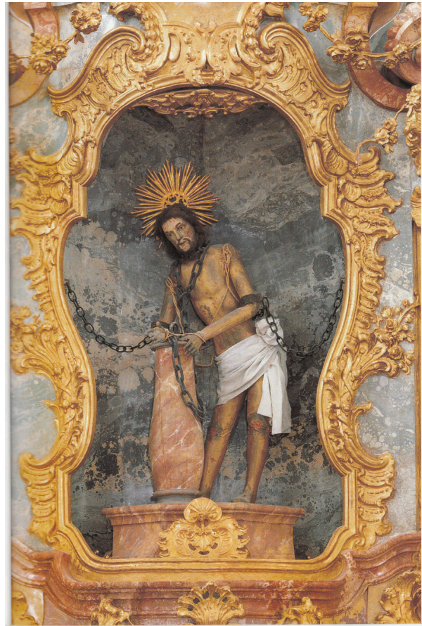
Iglesia de Wies: Imagen de Jesús en la columna del martirio

La nave es ovalada y hacia el este se estrecha culminando con el presbiterio y el altar. Hacia el oeste el nártex es más amplio. La vista de la nave obligadamente se dirige hacia el techo debido al diseño del adorno rococó, el cual es ínfimo al nivel del suelo y profuso y exuberante conforme se asciende. La cúpula está adornada con un inmenso fresco del Juicio Final. Caminando por la nave hacia el altar resalta la decoración sin paralelo del mismo: barandillas, columnas, imágenes, estucos dorados que encierran, por un lado en la parte inferior, a la imagen de Cristo venerado, y en la superior, el retablo pintado de Dios hecho Hombre. El espacio iluminado y esplendoroso del conjunto, el silencio sobrecogedor, el magnífico arte expuesto, inducen a una tranquilidad espiritual que sobrecoge al visitante.