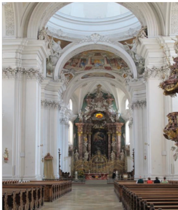
Nave principal de la Abadía de San Martín en Weingarten y altar al fondo https://monkschronicle.wordpress.com/tag/weingarten-abbey/