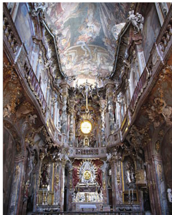
Iglesia de San Juan Nepomuceno: vista panorámica del interior. https://en.wikipedia.org/wiki/Asam_Church,_Munich