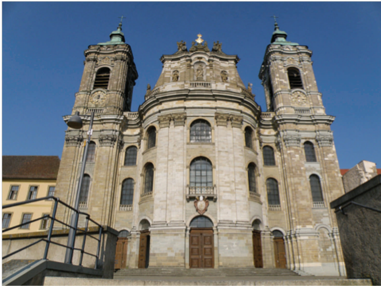
Vista exterior de la Abadía de San Martín en Weingarten localizada en un entorno urbano. http://www.spottinghistory.com/view/4963/weingarten-abbey/