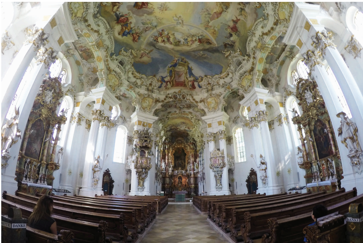
Nave principal de la Iglesia de Wies, fresco de la cúpula y el altar en el fondo Foto por Carla Sandoval de Rolz.

Foto en G. Kirchmeir, M. Hasenmüller The Wies Pilgrimage Church of the Scourged Saviour Verlag Wilhelm Kienberger Lechbruck