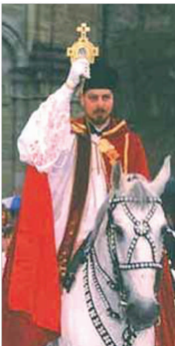
Abadía de San Martín en Weingarten: procesión del Relicario www.therealpresence.org/eucharst/mir/english_pdf/Weingarten1.pdf