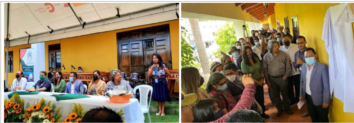
Figura 15. Ceremonia de Inauguración de la Exhibición “Mi Pasado Mi Historia”, Ecomuseo de San Andrés Semetabaj (Fotos por Andrés Ceballos, UVG).