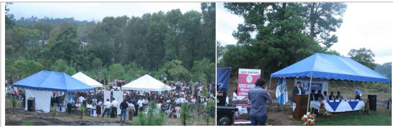
Figura 6. Apertura de la visitación del sitio arqueológico Semetabaj, en un acto conmemorativo del Oxlajuj Baktun, 21 de octubre 2012.