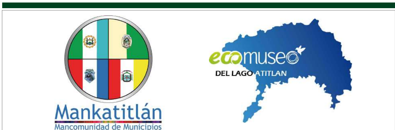
Figura 1. Logotipo de la Mankatitlán (izquierda) y del Ecomuseo del Lago Atitlán (derecha)

El consenso para la creación del Ecomuseo en los cuatro municipios de la Mankatitlán, fue un éxito, pero en términos de sostenibilidad y cumplimiento de las expectativas no lo fue, ya que la mancomunidad fue disuelta en el año 2015. De los cuatro municipios incluidos únicamente San Andrés Semetabaj mantuvo el sentido original del concepto Ecomuseo. El proyecto comprendió tres ejes principales traducidos en