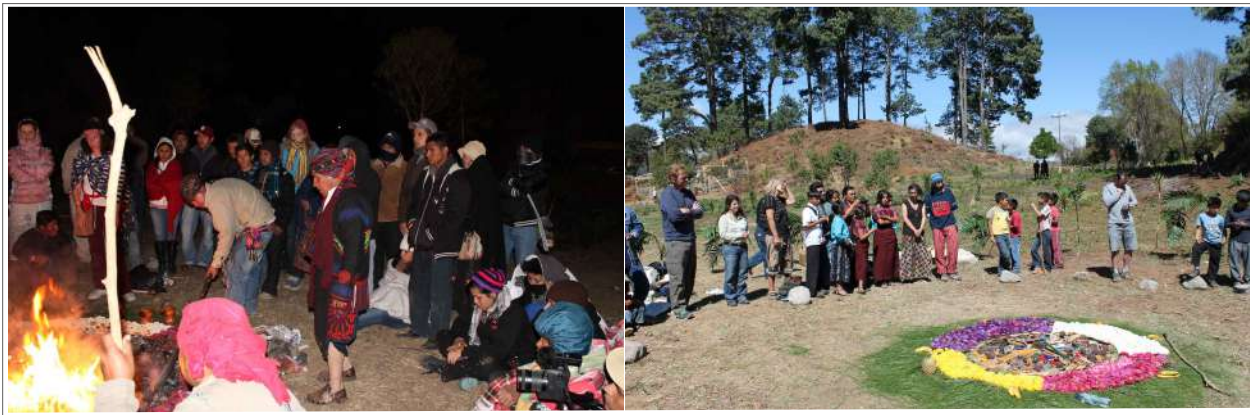
Figura 7. Ceremonia Maya realizada en el sitio arqueológico Semetabaj durante el final del Oxlajuj Baktun, 21 de diciembre 2012.