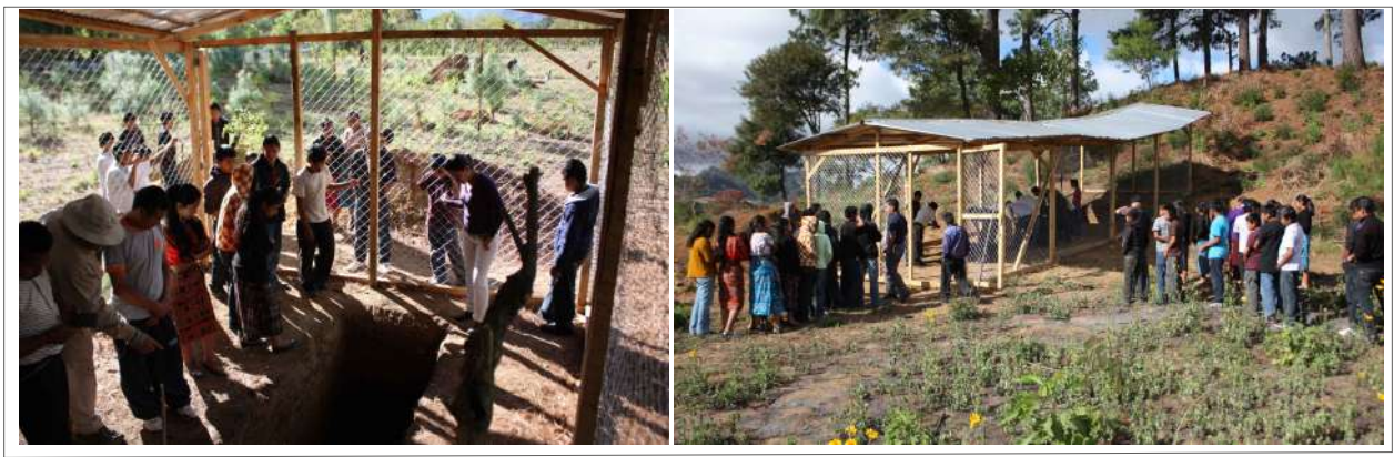
Figura 9. Visitas al sitio arqueológico Semetabaj para miembros de la comunidad, durante el proceso de excavaciones por parte de arqueólogos de la UVG.