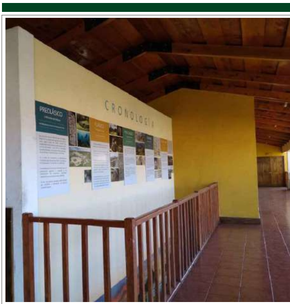
Figura 10. Colocación de infografía cronológica sobre San Andrés Semetabaj, en el segundo nivel del Ecomuseo, mes de octubre 2018.