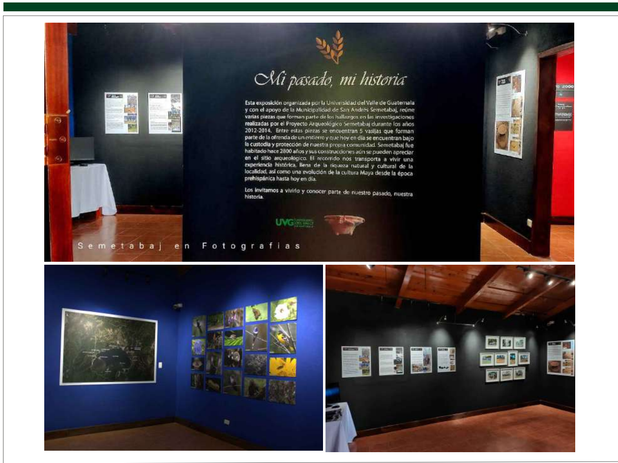
Figura 13. Exhibiciones en la Sala 1.