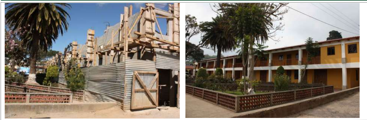
Figura 2. Edificio Ecomuseo San Andrés Semetabaj durante su construcción (arriba) y finalización (abajo) en 2011.