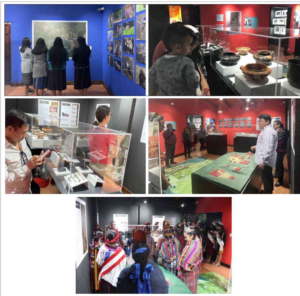
Figura 16. Visitantes en el Ecomuseo de San Andrés Semetabaj.