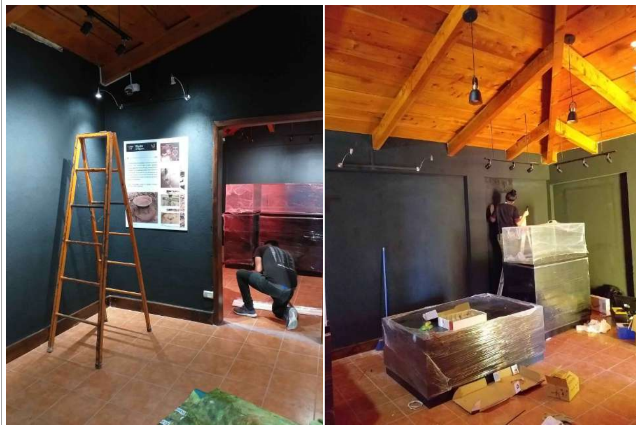
Figura 12. Proceso de montaje de la Exhibición Ecomuseo, en el año 2022.

arqueológicas, así como una maqueta del sitio y varias vitrinas con piezas arqueológicas de cerámica y lítica, destacando las vasijas de la Ofrenda 1 de la Estructura 12 (Figura 14). En esta iniciativa también se contó con apoyo financiero de la Agencia Española de Cooperación Internacional para el Desarrollo en Guatemala y la Fundación de la Familia Mack (UVG-San Andres Semetabaj Mack Family Initiative), así como el acompañamiento de la Doctora Mónica Stein, Vicerrectora de Investigación y Vinculación de la UVG, y la Doctora Pamela Pennington, Decana del Instituto de Investigaciones de la UVG.