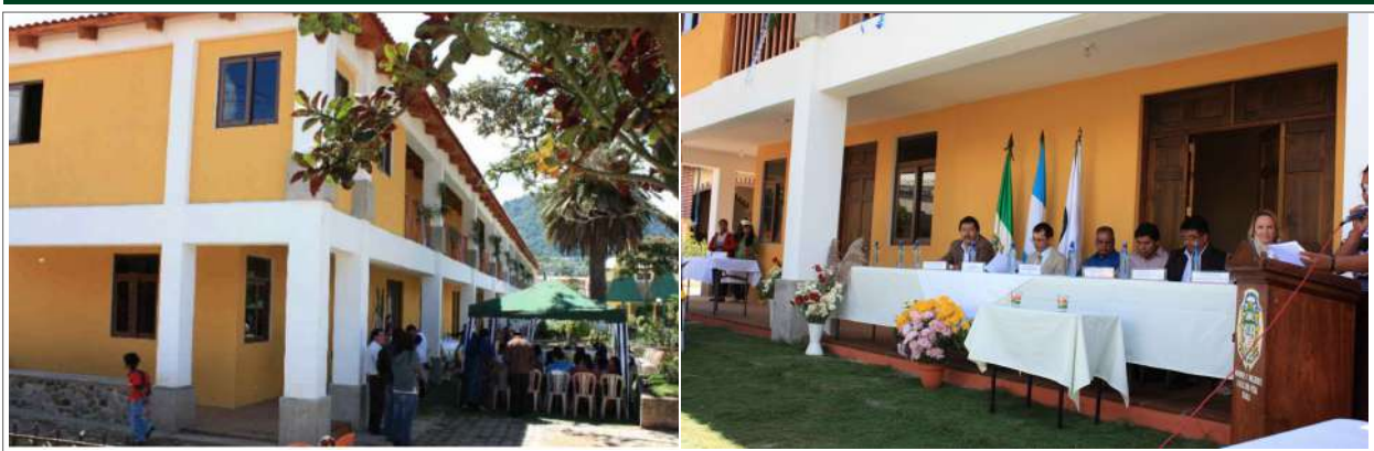
Figura 3. Inauguración Ecomuseo, 27 de julio 2011.

una ruta cultural turística que integra la vida cotidiana en: 1) la comunidad, 2) la cultura, y 3) el territorio. En los primeros años los avances fueron pocos, pero significativos, pues el 27 de julio del 2011 se inauguró el Centro de Visitantes y Sede Administrativa del Ecomuseo del Lago de Atitlán (Figuras 2 y 3); a partir de ese momento, se visibilizó un cambio hacia la revitalización de la cultura en el marco de los pueblos Kaqchikeles (de Paz 2011).