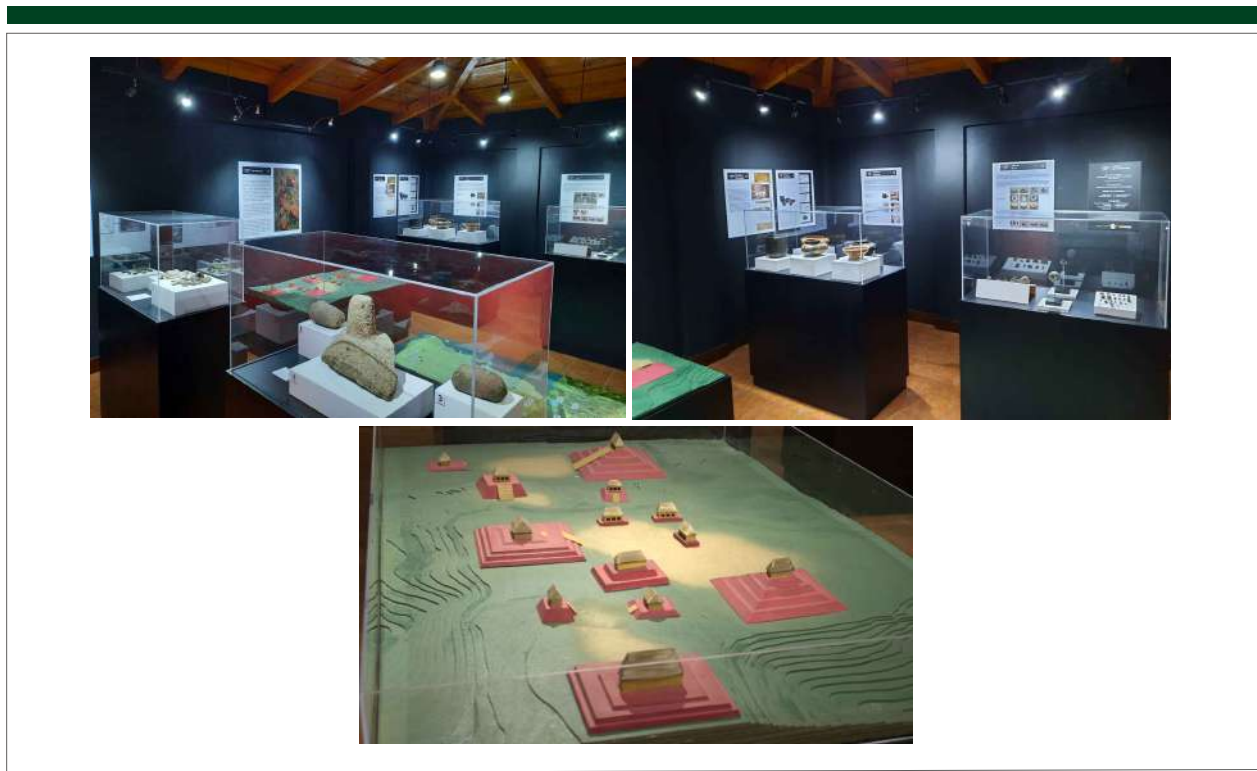
Figura 14. Exhibiciones en la Sala 2.