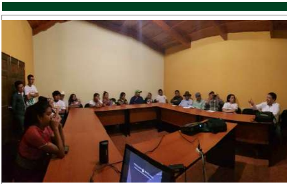
Figura 11. CDiscusión sobre astronomía cultural en uno de los salones del segundo nivel del Ecomuseo, 23 de noviembre de 2019.