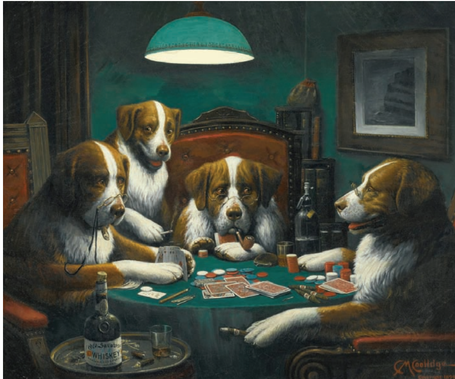
Juego de Poker / Cassius Marcellus Coolidge