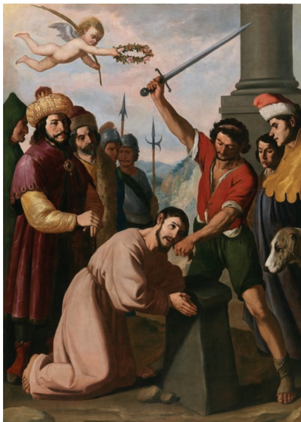
Martirio de Santiago