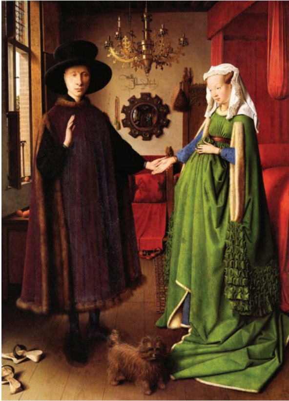
El matrimonio Arnolfini