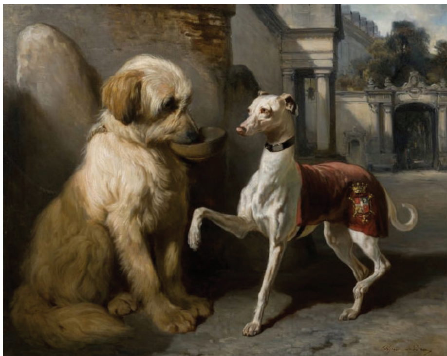
Rico y pobre / Alfred de Dreux

Desde su domesticación, el perro ha sido el fiel amigo del hombre y junto a él, le ha acompañado en muchas actividades a través de la historia. Ha sido retratado como animal de caza o compañía; incluso, ha sido personificado con atribuciones humanas, como es la famosa serie de 19 cuadros del estadounidense C.M Coolidge en donde se plasman de manera cómica a varios perros jugando póker o billar.