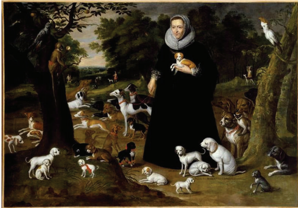
Doña Juana de Lunar con los perros de la infanta Isabel