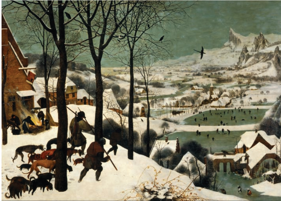
Cazadores en la nieve

Un punto interesante es la inclusión de un perro en el desnudo de La Venus de Urbino - un posible regalo de boda al óleo sobre lienzo del pintor Tiziano, en el que la diosa griega es acompañada por un papillón durmiendo, representando fidelidad y realeza -otra vez-, por su raza. Caso contrario, el desnudo de Olimpia , a cargo de Édouard Manet, en el que se asemeja a la venus anterior, con la salvedad que incluye un gato negro, símbolo de prostitución.