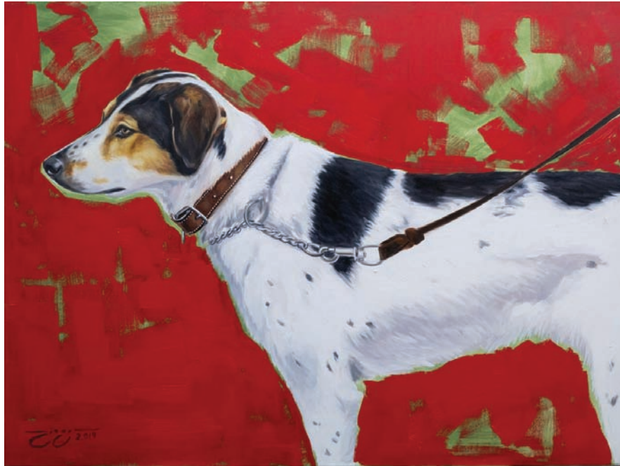
serie Testigos Urbano / Jorge Mazariegos Maldonado

Para no dejar de lado el arte guatemalteco, cabe mencionar a Jorge Mazariegos Maldonado, artista contemporáneo que pinta perros de distintas razas en su serie Testigos Urbano. Su peculiaridad es el retrato de canes encontrados a su paso en las calles de la ciudad que, según el artista, reflejan la vulnerabilidad del ser humano. Por último, una gran obra descubierta al momento de realizar el ensayo: Salvada, de Edwin Landseer. Pintura que demuestra el cansancio del perro terranova landseer luego de sacar a su pequeña amiga del agua, esperando -casi suplicando- a que vuelva a la vida. Es así, que los perros demuestran mucho más sentimiento que otras personas y estos han sido plasmados a través de la historia del arte.