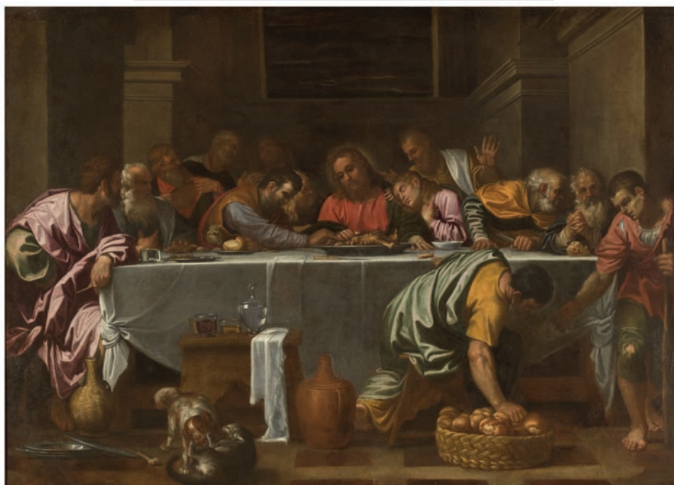
La última cena / Agostino Carracci

Ambas pinturas con tema religioso forman parte de muchas que incluyen canes. Más aún, la Iglesia Católica dota de simbolismos las distintas posturas de los perros en muchas obras donde se plasma la última cena de Cristo. Según el portal Desde la Fe, la presencia de un perro recostado en el suelo denota amor y fidelidad de Jesús hacia sus apóstoles. Si el perro está peleando con el gato ¡oh coincidencia! denota la lucha del bien contra el mal. Y si el perro se encuentra de pie esperando alguna dádiva de Judas, demuestra la traición por el dinero.